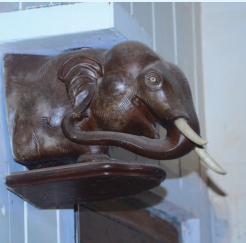
മാപ്രാണം പള്ളിയിലെ ആനകൾ