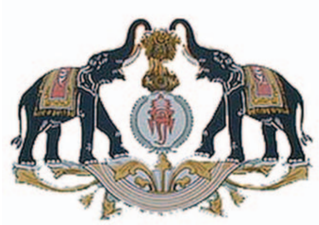
കൊച്ചി, തിരുവിതാംകൂർ, തിരുക്കൊച്ചി, കേരള സർക്കാർ ചിഹ്നങ്ങളിലെ ആനകൾ

എന്നിന്, കൊച്ചിരാജ്യത്തിന്റെയും തിരുവിതാംകൂറിന്റെയും, തിരുക്കൊച്ചിയുടെയും ഇപ്പോൾ കേരളത്തിന്റെയും ഔദ്യോഗിക ചിഹ്നത്തിൽ ആനയുണ്ടല്ലോ. “ആനവണ്ടി”കൾക്ക് ആ പേർ കിട്ടിയത് ആ ആനകളിൽ നിന്നു തന്നെ.