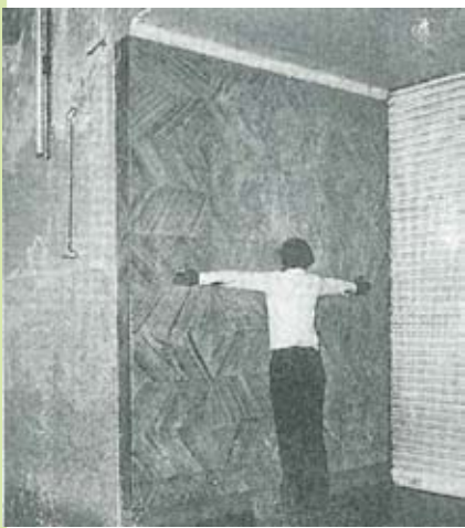
പഴയ കോട്ടപ്പടി പള്ളിയുടെ ദിത്തിവണ്ണം, 1980