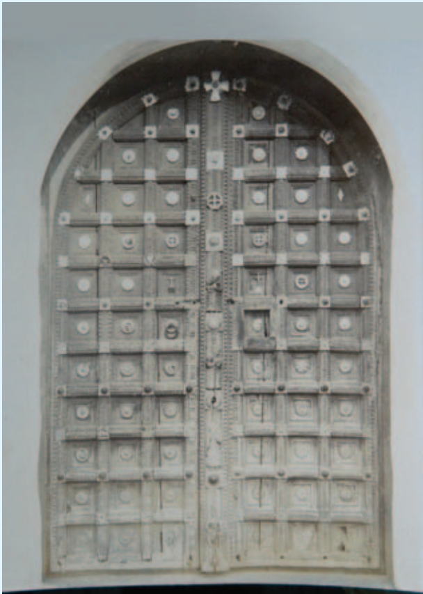
1974-ലെ ഹോസ്സൻ ഹോട്ടോ.