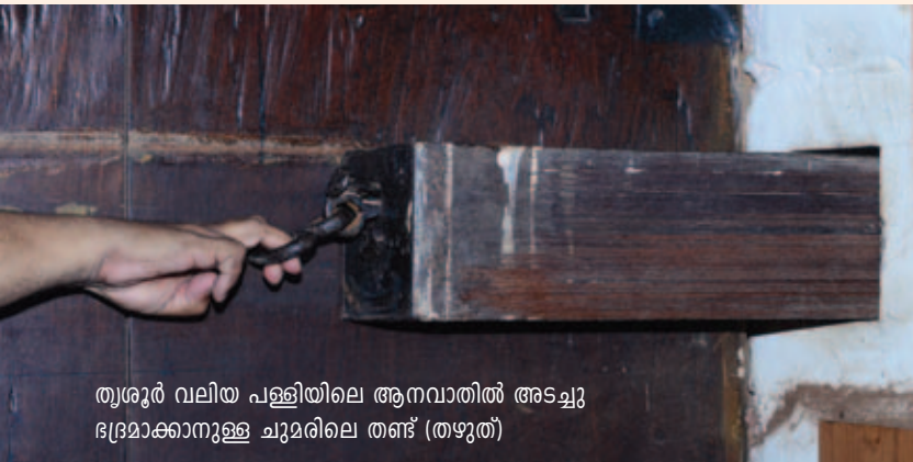
തൃശൂർ വലിയ പള്ളിയിലെ ആനവാതിൽ അടച്ചു ഭദ്രമാക്കാനുള്ള ചുമരിലെ തണ്ട് (തഴുത്)

ഹിന്ദുമതത്തേക്കാൾ ഈ മണ്ണിൽ പഴക്കമുള്ള നസ്രാണി സമൂഹത്തിനുമാത്രം അവകാശപ്പെടാവുന്ന ആദ്യകാലം തൊട്ടുള്ള ഒരു സാംസ്കാരിക ചിഹ്നമാണ് ഈ രണ്ടു കരിവീരന്മാർ.