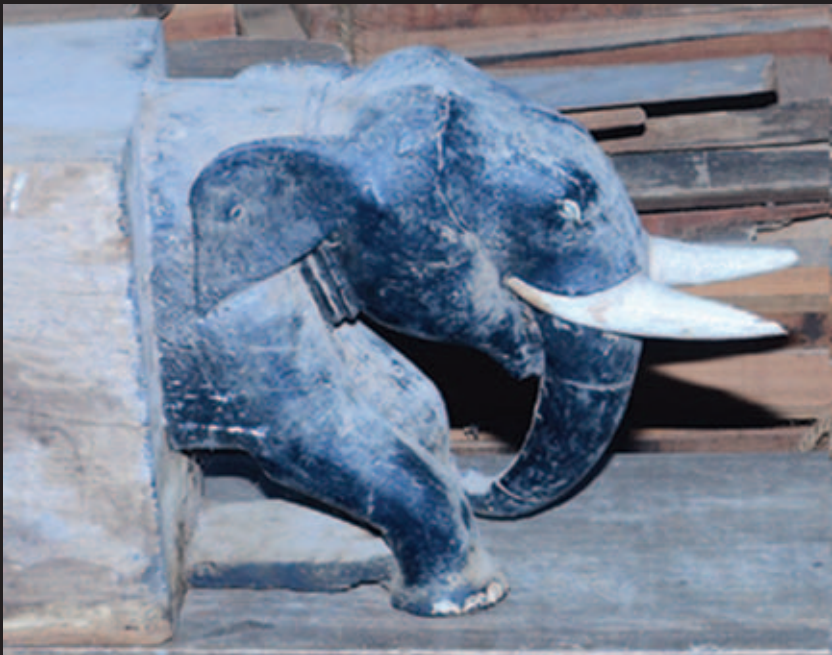
വടക്കൻ പുതുക്കാട് പള്ളിയിലെ (എ.ഡി.400) ആനകൾ - പാഴ്ചരങ്ങൾക്കിടയിൽ.