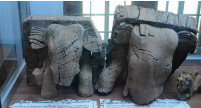
പാലയൂരിലെ ഗജദായം, ദാരൂശില്പം, പാലയൂർ പള്ളി മ്യൂസിയം.

ആനയ്ക്ക് രണ്ടുപയോഗമാണ്: ഒന്ന്, ആഘോഷങ്ങൾക്ക് എഴുന്നള്ളിയ്ക്കാൻ; രണ്ട്, തടി പിടിയ്ക്കാൻ; നൂറ്റാണ്ടുകളായി എല്ലാ പഴയപള്ളികളുടെയും ശീലാന്തി താങ്ങുന്നത് രണ്ടാനകളാണ്. ഒരറ്റം താങ്ങുന്നത് നെറ്റിപ്പട്ടാദി ഭൂഷകളണിഞ്ഞ പെരുന്നാൾ ആന. മറ്റെ അറ്റം താങ്ങുന്നത് ഒഴുക്കൻ പണിയാന. പഴയ പാലയൂർ പള്ളിയിലെ ഈ രണ്ടാനകളെയും അവിടുത്തെ ചരിത്രസാംസ്കാരിക മ്യൂസിയത്തിൽ കണ്ടുമുട്ടാം.