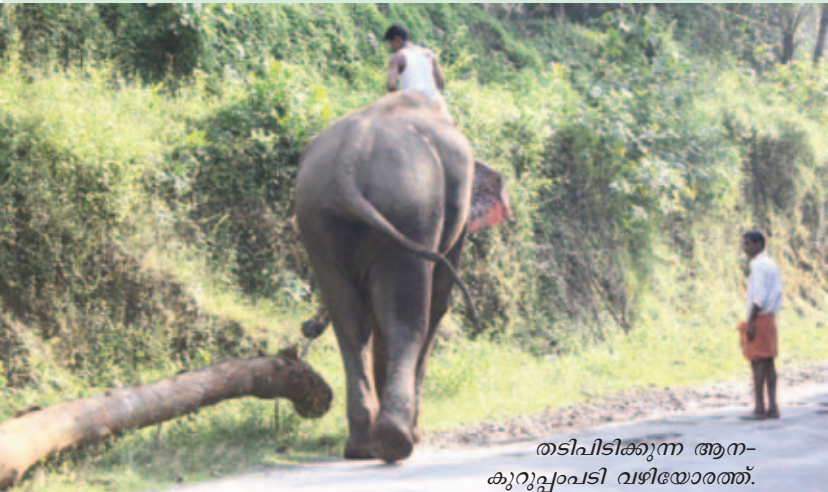
തടിപിടിക്കുന്ന ആന- കുറുപ്പംപടി വഴിയോരത്ത്.

ആനച്ചന്തം, ആനനട, ആനച്ചമയം, ആനപ്രേമം, ആന ക്കാര്യം, ആനക്കോപം എന്നിങ്ങനെ എത്രയെത്ര ശൈലികൾ. മലയാളത്തിൽ ആനക്കഥകളും ആനപ്പഴഞ്ചൊല്ലുകളുമുണ്ട് ഒട്ട നവധി.