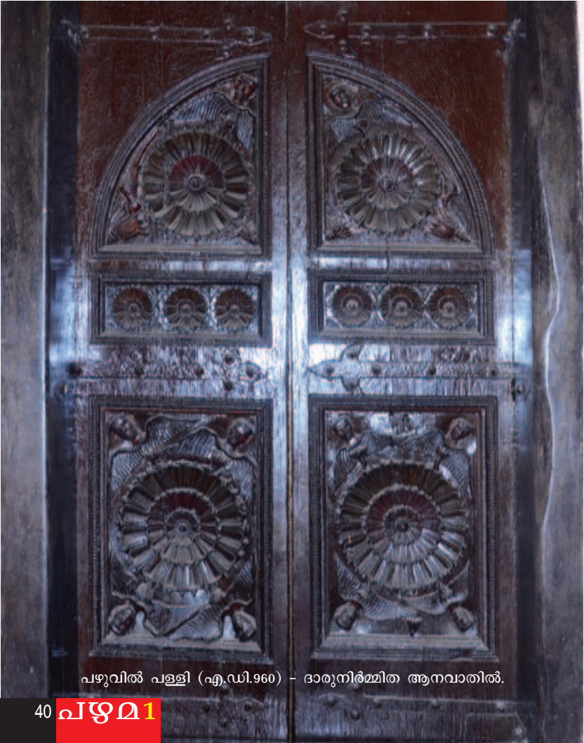
പഴുവിൽ പള്ളി (എ.ഡി.960) - ദാരുനിർമ്മിത ആനവാതിൽ.