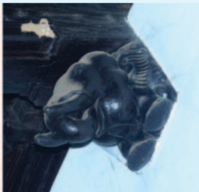
പാലിയേക്കര പള്ളി, തിരുവല്ല.