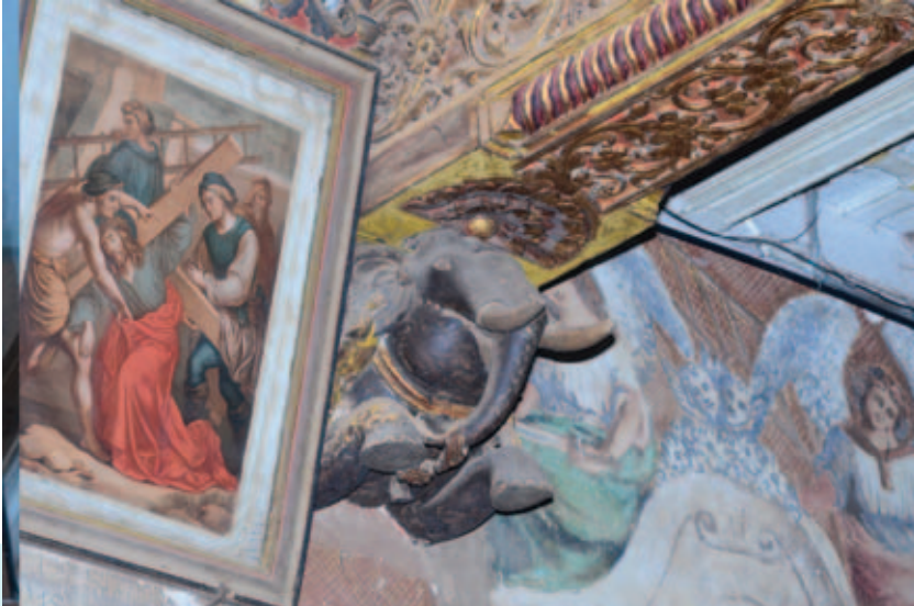
ഒല്ലൂർ പള്ളി - എ.ഡി.1718 - പണിയാന, ദാരുശില്പം

വടങ്ങളിലെ യാക്കോബായ - ഓർത്തഡോക്സ് - സുറിയാനിക്കത്തോലിക്ക ആദിയായ പഴയപള്ളികളിലെല്ലാം തന്നെ ശീലാന്തി താങ്ങുന്ന കരിവീരന്മാരെ നാം കണ്ടുമുട്ടുന്നുണ്ട്. പെരിയാറിന് വടക്കുഭാഗത്താണ് ഇന്ന് തെക്കുള്ളതിൽ കൂടുതൽ ആനകൾ പള്ളികളിൽ കാണപ്പെടുന്നതെന്ന് തോന്നുന്നു.