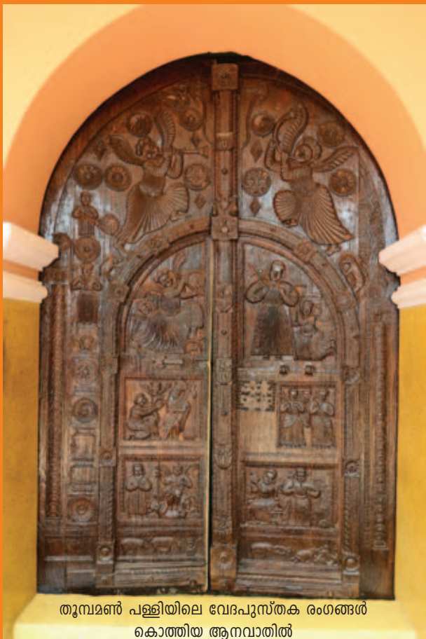
തുമ്മമൺ പള്ളിയിലെ വേദപുസ്തക രംഗങ്ങൾ കൊത്തിയ ആനവാതിൽ